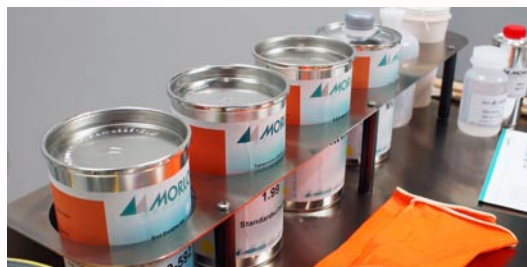
Halterungen für Farbdosen und Hilfsmittel

Optimiert für den Einsatz beim Tampondruck, ist der MW700 2.0 ausgestattet mit Fächern zur Aufbewahrung von Hilfsmitteln, Tampons, Werkzeugen und vielem mehr. Für Reinigungsarbeiten ist außerdem ein Papier-Handtuch-Halter integriert.